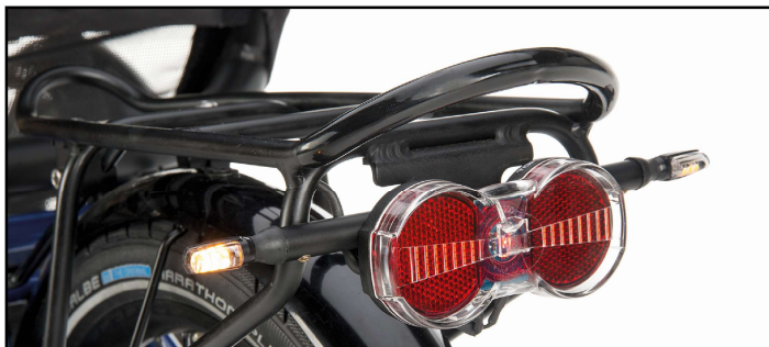
Bilder 1-3 von oben nach unten: Blinkschalter, Blinker an der Trike-Vorderseite, Blinker an der Trike-Rückseite. Die Montage an Ihrem Trike kann variieren.