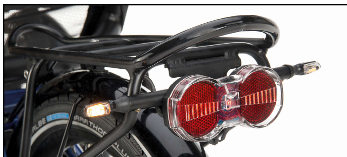
Fig. 1-3 from top to bottom: Indicator switch, indicators on the trike's front side, indicators on the trike's rear side. The mounting situation on your trike can vary.